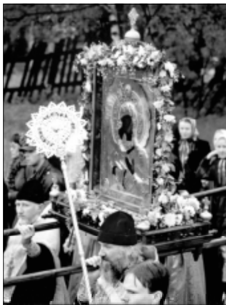
Фото с Крестного хода

Ж елающим приобрести фотографии Крестного хода с Феодоровской иконой Божией Матери обратиться в фотостудию по адресу: ул. Вологодская, 25.