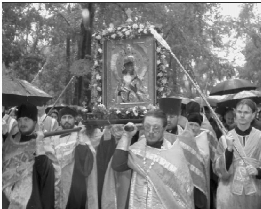
Крестный ход с чудотворной иконой в Архангельске.

Несколько дней в Архангельске пребывала Феодоровская икона Божией Матери