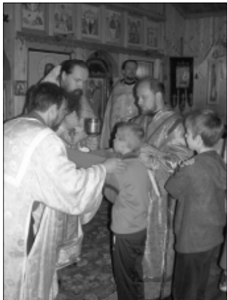
(Окончание. Начало на 2-й стр.).

В программе празднования — возложение цветов на могилы погибших, торжественное построение. На центральной площади города была представлена тематическая программа, посвященная юбилею, прошло театрализованное представление, состоялись посещения воинских частей космодрома, встречи с личным составом.